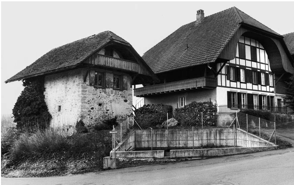
254 Merzligen. Steinstock Jengasse 2A, davor der Feuerweiber. Foto 2004.

Schlachtdenkmal 21 auf der Anhöhe am Wald-rand, westlich an der Durchgangsstrasse (Koord. ca. 585.325/215.875), oberhalb des Schlachtfeldes auf der Bellmunder Seite. Im Zusammenhang sich über-stürzender Ereignisse blieb das Gefecht des frühen 5. März 1798 ohne strategische Bedeutung. Auf der Grabstätte der 16 gefallenen Berner liess Niklaus Heilmann vom Bellevuegut bei Port, der letzte Fürs-tenschaffner Biels, sogleich einen Pfahl setzen, den er mit einer langen, leidenschaftlichen Inschrift ver-