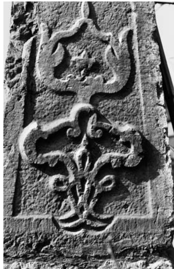
247–248 Jens. Dorfbrunnen. Obelisk-Stock von 1752. Fotos aus den 1940er Jahren (am früheren Brunnenstandort vor dem Haus Dorfplatz 2) bzw. 1995 (Detail der Südseite).