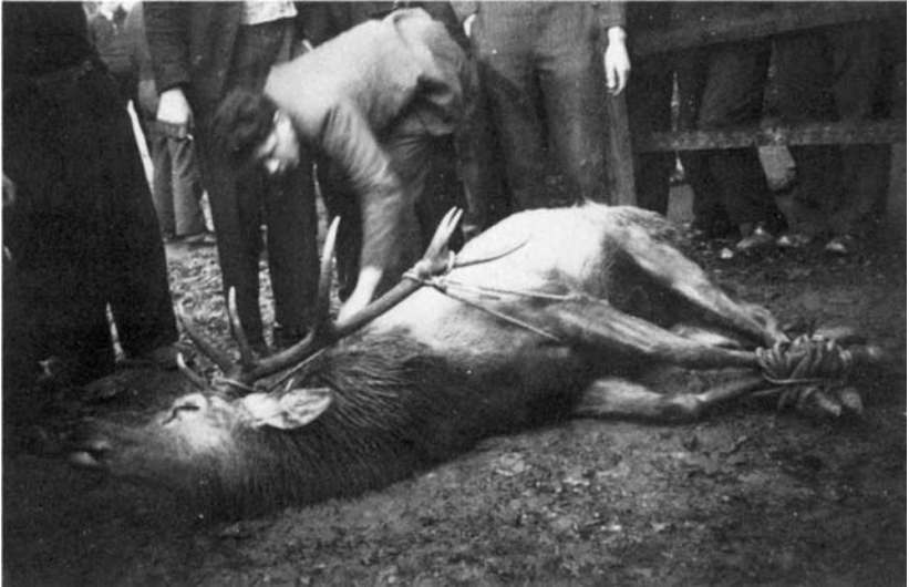
Das Ende der «heiteren Hirschjagd» von 1939: Waldhof-Schüler beim Fesseln des Hirsches.

eigentliches Unglücksjahr wird auch 1905 bezeichnet. In der Nacht auf den 23. Mai wurde ein Stück des Geheges eingerissen. Fünf Rothirsche entwichen. Während drei von ihnen von selber zurückkehrten, gelang es trotz grossen Bemühungen nicht, einen Hirsch und eine Hirschkuh wieder einzufangen. Den ganzen Sommer hindurch wurden die Tiere wiederholt in den Wäldern der Umgebung gesehen.