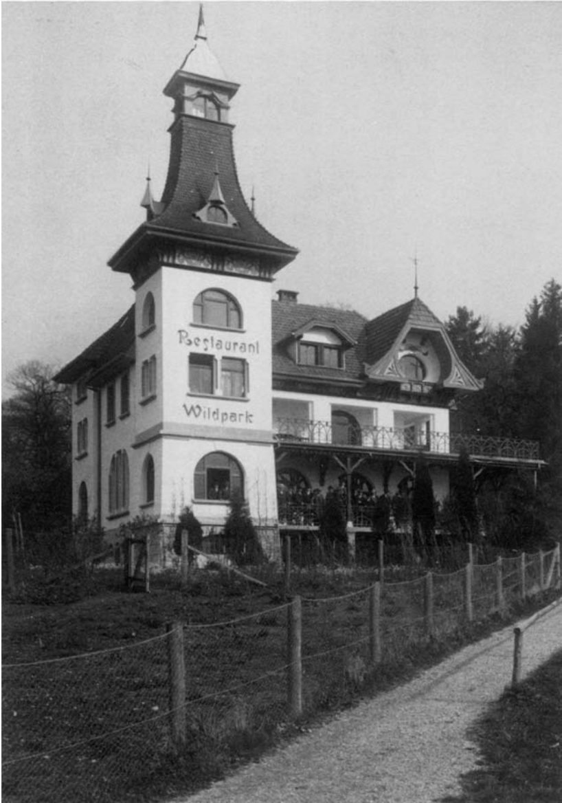
Das Restaurant Wildpark, 1902 erbaut, 1970 abgerissen.