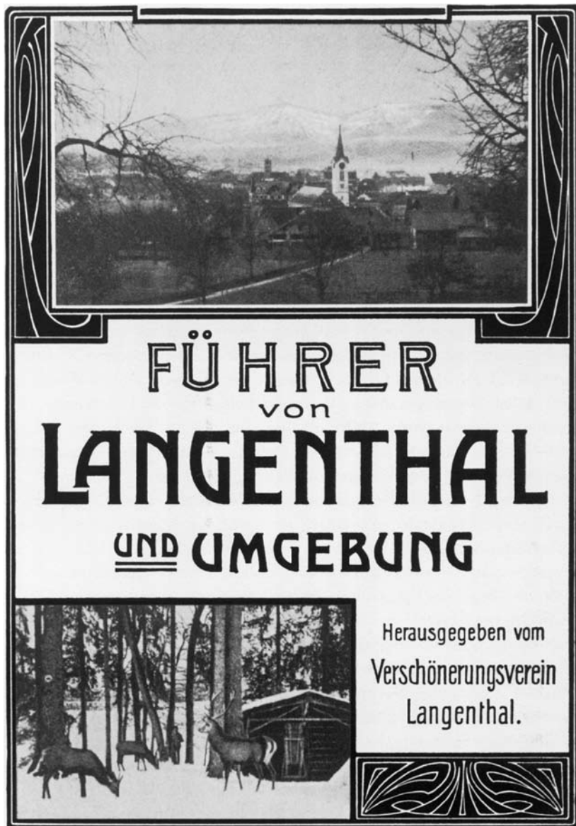
Titelblatt des «Führers von Langenthal und Umgebung», der 1904 für den Verein eine Pionierleistung darstellte.