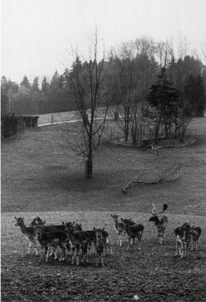
Das Damhirschrudel in seinem Gehege.