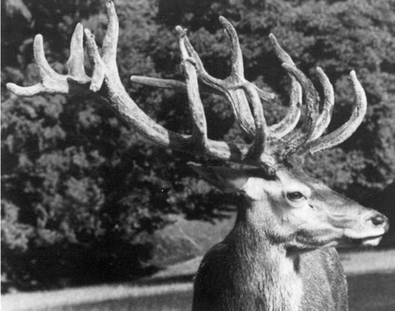
Platzhirsch «Adrian» (geboren 1982), Stolz und Wahrzeichen des Tierparks.

grenzenden Anlage beklagt. Der Verschönerungsverein war diesbezüglich bereits in den zwanziger Jahren bei den Schützen vorstellig geworden, um eine Reduktion der Schiesstage zu erwirken. Die Schützen ihrerseits liebäugelten längst mit einer Anlage, die ihren Bedürfnissen besser gerecht würde.